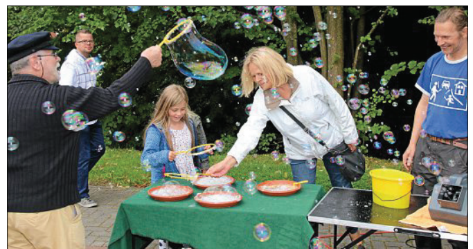
Beim Mitmachzirkus konnten sich Jung und Alt ausprobieren, so auch beim Seifenblasen.