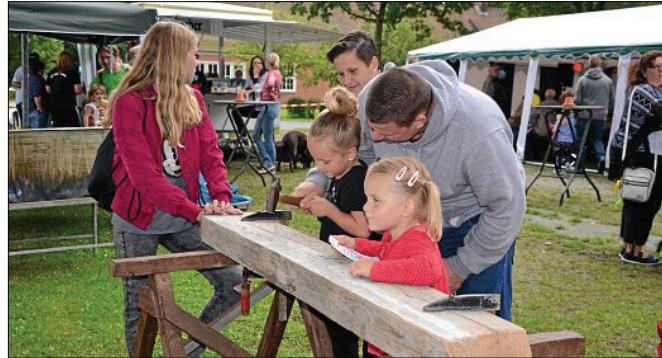
Mit ein wenig Hilfe schafften es auch die Kleinen Besucher nach ein paar kräftigen Schlägen den Nagel im Holz zu versenken.

Das Thema in diesem Jahr war „Spielen wie zu Omas Tieden“. Geboten waren Attraktionen wie Teebeutel-Weitwerfen, Dosenwerfen, Eierlaufen oder Nägelhauen. Eigentlich gedacht um den Kindern Spiele von früher näherzubringen, brachten sie aber auch den Erwachsenen jede Menge Spaß.