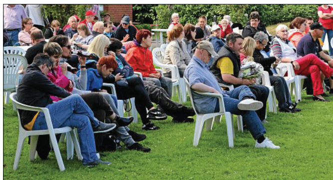
Beim Nachbarschaftsfest feiern die Bewohner vom Haus Uldinga gemeinsam mit ihren Nachbarn und Freunden ein Sommerfest mit buntem Programm.

ohne Gage auf. Bereits vor ihrem Auftritt wurden die Sängerinnen herzlich begrüßt und sorgten für ausgelassene Stimmung. Nach der obligatorischen Zugabe wurde zum Ende der Veranstaltung die große Tombola ausgelost. Neben eigenen Produkten aus Werkstatt und Gärtnerei der Behindertenhilfe Norden gab es zahlreiche Sachspenden der örtlichen Händler und Gewerbetreibenden zu gewinnen.