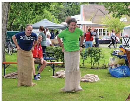
Beim Dorffest in Leybucht-polder durften auch die Erwachsenen noch einmal Kind sein und beim Sackkämpfen um die Wette hopen.