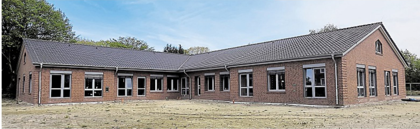
Das Haus selbst steht bereits, das Innenleben fehlt jedoch noch. Die Arbeiten laufen auf Hochtouren: Denn zum neuen Kindergartenjahr soll die KiTa „Bunt.Punkt“ möglichst fertig sein, so der Wunsch.

Dieser soll eine Kletterwand, ein Balkensystem für Schaukel und Hängematte sowie eine „Kindermangel“ haben. „Da können sich die Kinder dann so durchquetschen“, erzählt Siewert begeistert. Für die Kleinen ist