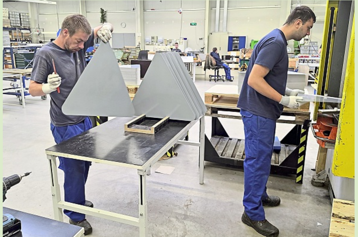
Hier werden Verkehrsschild-Rohlinge für einen Nachbarbetrieb Leegemoor in Form gebracht.

Wir gratulieren zum Firmenjubiläum und wünschen Ihnen weiterhin viel Erfolg!