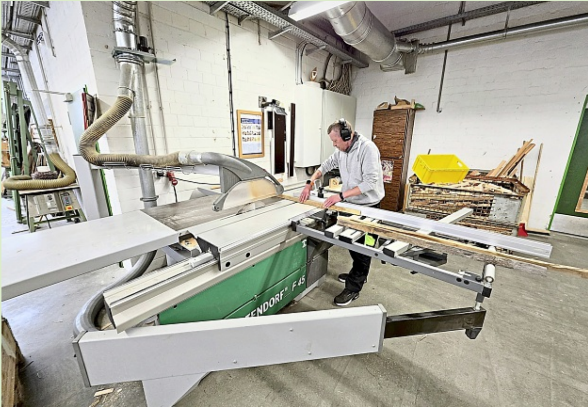
Bei den geführten Rundgängen können Besucher auch die Tischlerei in Augenschein nehmen.