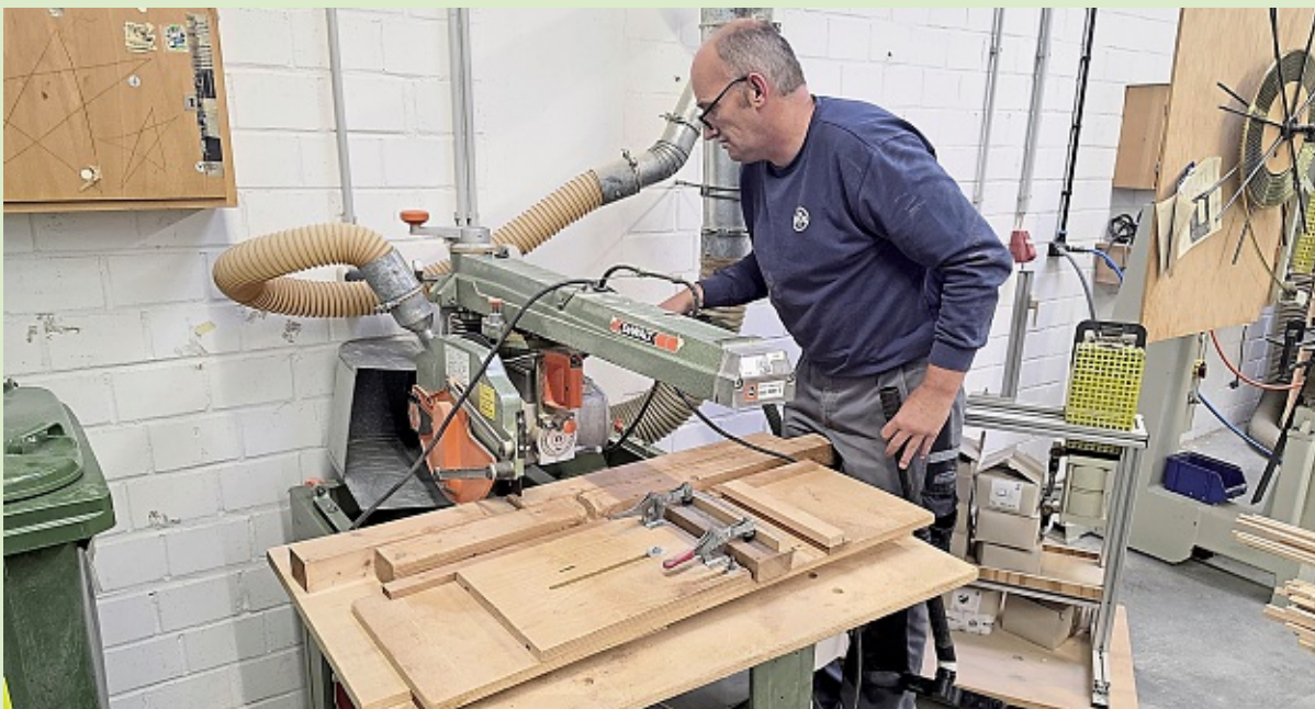
Beim Rundgang durch die BIRKO-Werkstätten wird sichtbar, wie Eigenproduktion und industrielle Fertigung Hand in Hand gehen.

schau nach farbigen Buchstaben gehalten und diese in einen Bogen eingetragen werden. In die richtige Reihenfolge gebracht, wird der Bogen mit dem Lösungswort dann bei den Mitarbeitern abgegeben und mit etwas Glück darf man bald eine Feuerschale, ein Hochbett oder eine Wanduhr sein eigen nennen - natürlich "Made by BIRKO".