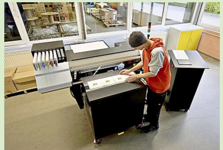
Der Industriedrucker bedruckt beliebte Eigenprodukte wie das Ostfrie- sen-Barometer.

Seit 30 Jahren bietet die Werk- statt für behinderte Menschen berufliche Bildung, angepasste Arbeitsmöglichkeiten sowie zahlreiche Angebote zur Arbeitsförderung und Persön-